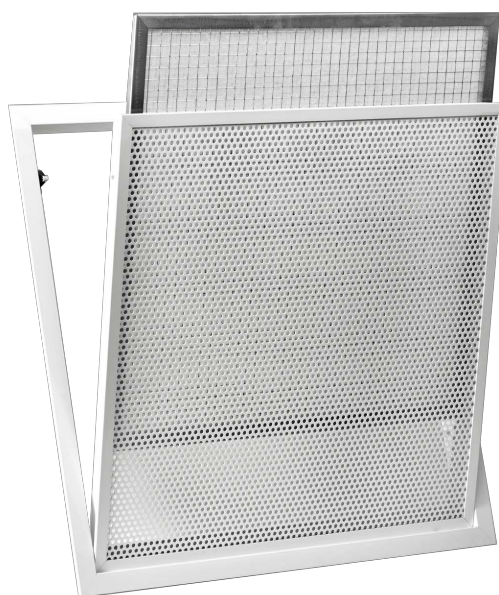
KQD-FP avec filtre

+Reproduction interdite sans autorisation. Les spécifications techniques sont données sous réserve de modification sans préavis. Photos et illustrations non contractuelles.